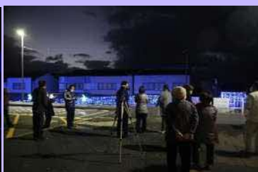
1月20日(金)イルミネーション点灯式を行いました。寒い中多くの皆様にご参加いただきありがとうございました。