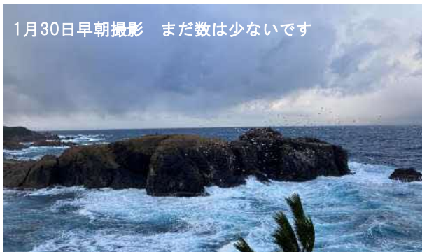
1月30日早朝撮影 まだ数は少ないです

経島はウミネコの繁殖地として国の天然記念物に指定されています。毎年3000羽くらいたくさんのウミネコがやってきます。日本には何十万羽もいるのに、繁殖地を大切にしているのは、かつて日本近海の離島で繁殖していた“アホウドリ”を羽毛布団にする目的でほとんど絶滅させるところまで捕獲していった例があるからです。みんな、大切に見守っていきましょう。